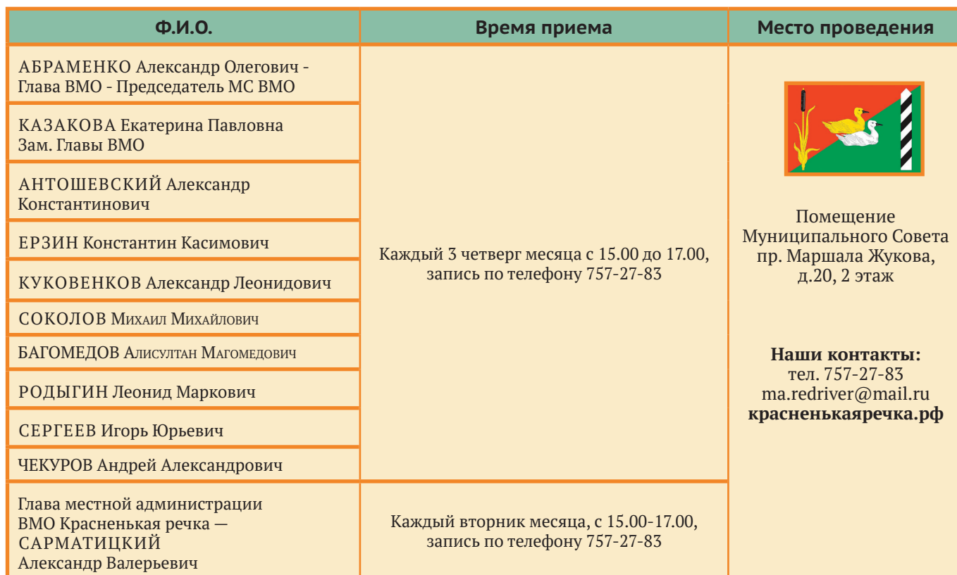
График приема депутатов Муниципального Совета муниципального образования Красненькая речка